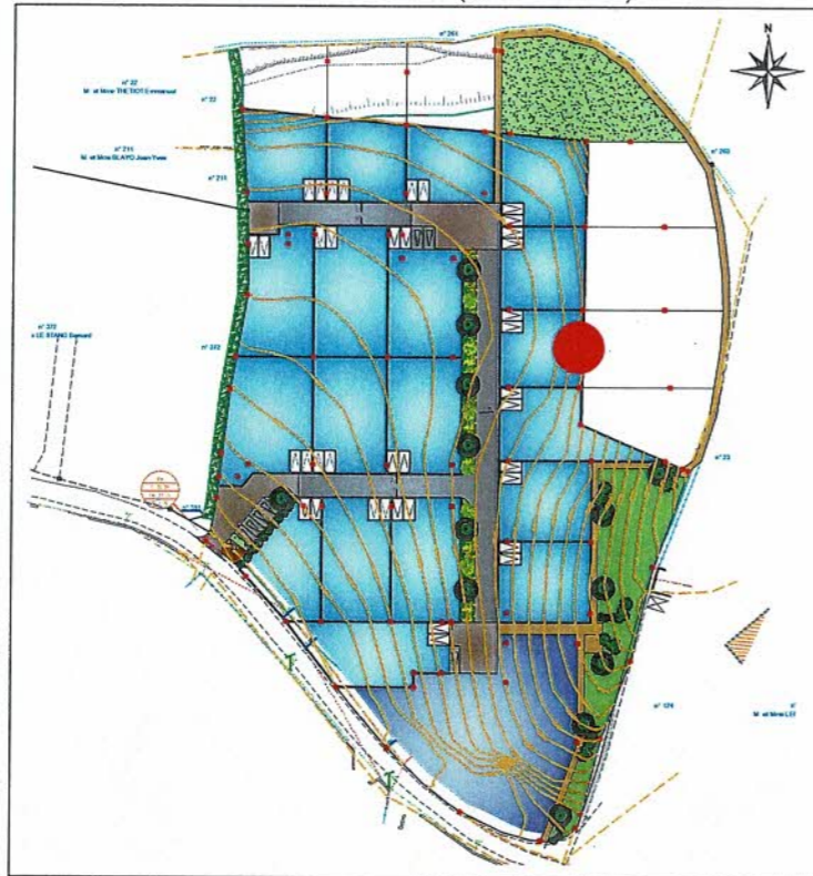
Plan de situation (sans échelle)

SELARL NICOLAS ASSOCIES - Géomètres-Experts Successeur du cabinet HUIBAN Agence de LORIENT 13 rue du Sous-Marin Vénus - BP 656 - 56106 LORIENT Cedex Tel: 02 97 21 01 03 Fax: 02 97 64 28 83 E-mail: lorient@sarlnicolas.fr