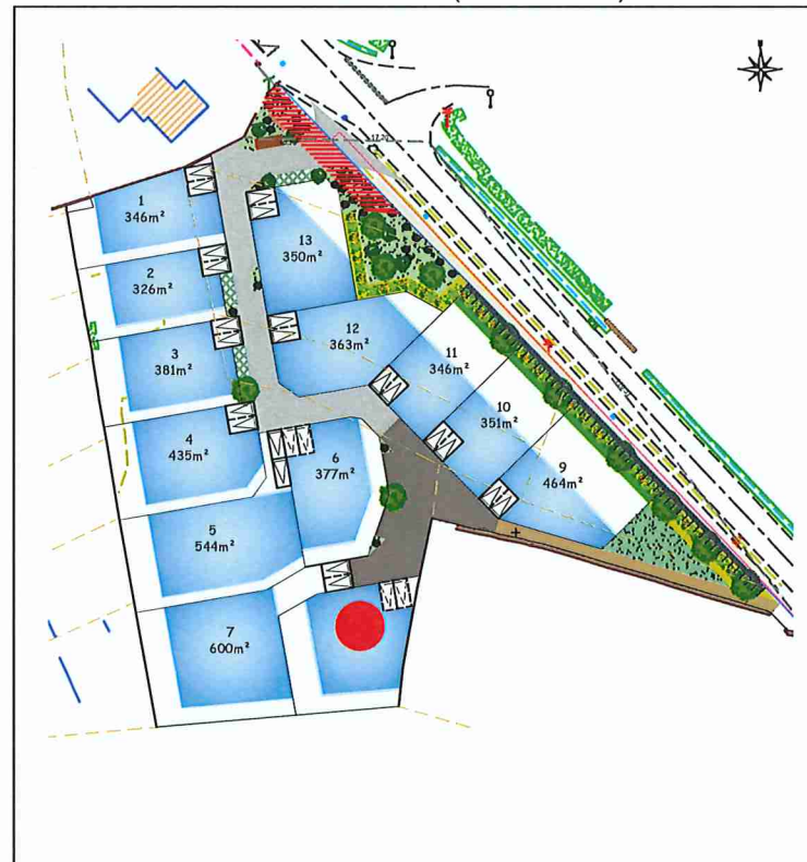
Plan de situation (sans échelle)

Ordre des Géomètres-Experts SELARL NICOLAS ASSOCIÉS Régis DUCLOS - N° Inscription à l'ordre 06308 Immeuble Océania - Porte océane 2 23 Rue du Danemark - 56400 AURAY Tel : 02 97 24 12 37 - Email : auray@sarlnicolas.fr